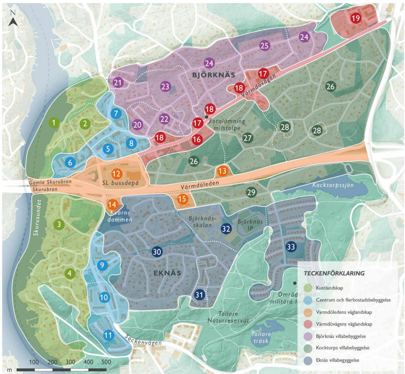
Figur 1. Landskapets och bebyggelsens karaktärer i Björknäs och Eknäs. Numreringen återfinns i nedanstående avsnitt.

Gemensamt för i stort sett all bebyggelse är att den håller sig under trädtoppsnivån vilket tillsammans med en generell låg exploateringsgrad gör att såväl Björknäs som Eknäs upplevs mycket gröna och lummiga. Undantaget är Björknäs centrum som innehåller mindre grönska och där flerbostadshusen når ovanför trädtopparna.