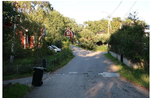
Figur 23. Äldre villabebyggelse vid Eklundavägen.

I Eknäs finns också exempel på förtätning där villatomter har omvandlats till små flerbostadshus eller radhus. Sådana tomter saknar i allmänhet helt den landskapsanpassning och grönska som präglar resten av villabebyggelsen.