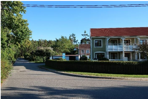
Figur 25. Radhus från 1980-talet vid Apollonvägen.

Parhusen utmärks av sina röda tegelfasader och branta sadeltak med takkupor. Slutningsläget gör att bebyggelsen är väl anpassad till landskapet, men jämfört med de intilliggande villorna är skalan något högre.