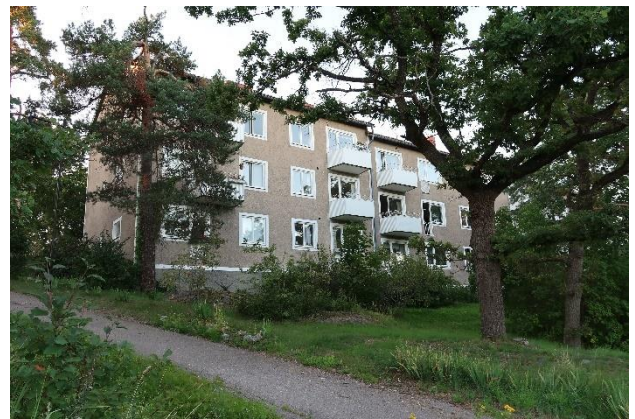
Figur 14. Välbevarat flerbostadshus vid Lövdalsvägen.