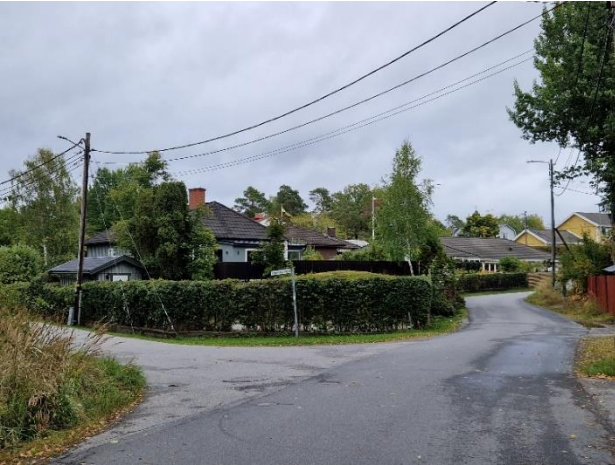
Figur 21. Varierad villabebyggelse vid Skjutbanevägen-Bågspännarvägen.