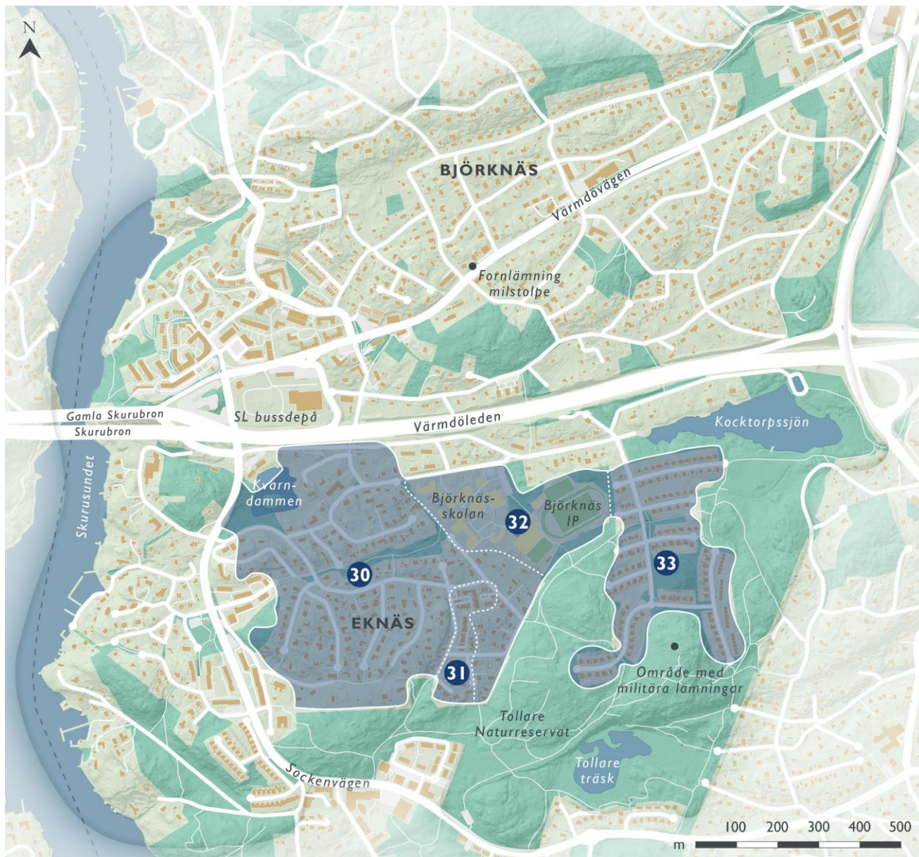
Figur 28. Landskaps- och bebyggelsekaraktärer i villabebyggelsen i Eknäs, delområde 30 - 33.