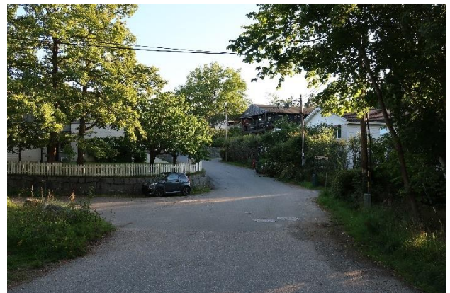
Figur 24. Villabebyggelse från 1970-talet vid Bromsvägen.