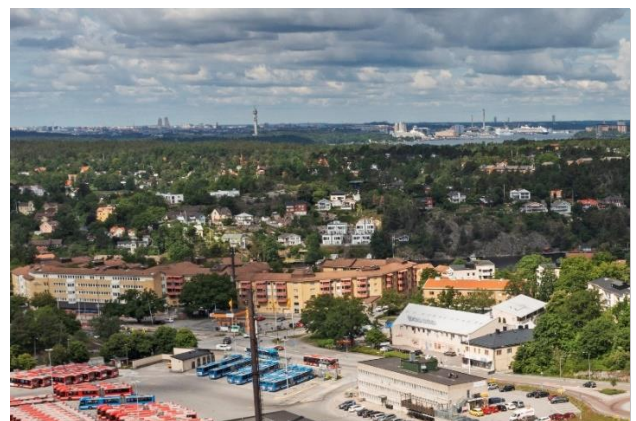
Figur 5. Flygvy över Björknäs centrum.

Väster om centrumbebyggelsen och intill gamla Skurubrons landfäste ligger ett större område med flerbostadshus från 1980-talets mitt. Bebyggelsen är anpassad till terrängen och kombinerar tidstypisk storgårdsstruktur närmast centrumet med lamellhus i slutningen ner mot Skurusundet. För den generellt låga bebyggelseskalan i Björknäs är området storskaligt med upp till fem våningar i storgårdskvarteren. Läget gör att flera lägenheter har utsikt mot sundet, men medför också att de högre delarna höjer sig över trädlinjen och utgör ett större inslag i silhuetten från vattnet. Bebyggelsen med fasader av gult tegel och röda balkonger har visst drag av postmodernism. Söder om flerbostadshusen ligger ett kontorshus i fyra till fem våningar med liknande formspråk som även fungerar som ett bullerskydd mot trafiken.