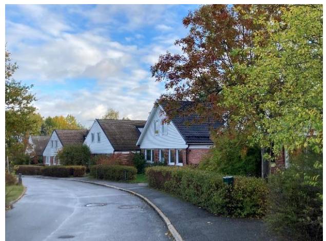
Figur 27. Hjortängens karaktäristiska bebyggelsestruktur.

De första husen färdigställdes vid årsskiftet 1969-1970. Enligt samtida uppgifter kunde husen vara inflyttningsklara redan två veckor efter leverans. Genom en planändring 1976 möjliggjordes att de ursprungliga enplanshusen kunde byggas på med en vindsvåning under ett brant sadeltak. Detta har lett till att hushöjderna varierar mellan olika gator. Fasaderna på både grändhusen och radhusen är klädda med rött fasadtegel. Gavlar och takfot är på grändhusen, oavsett takform, klädda med liggande, vitmålad fjällpanel, medan radhusen har fjällpanel i mörkbrun kulör.