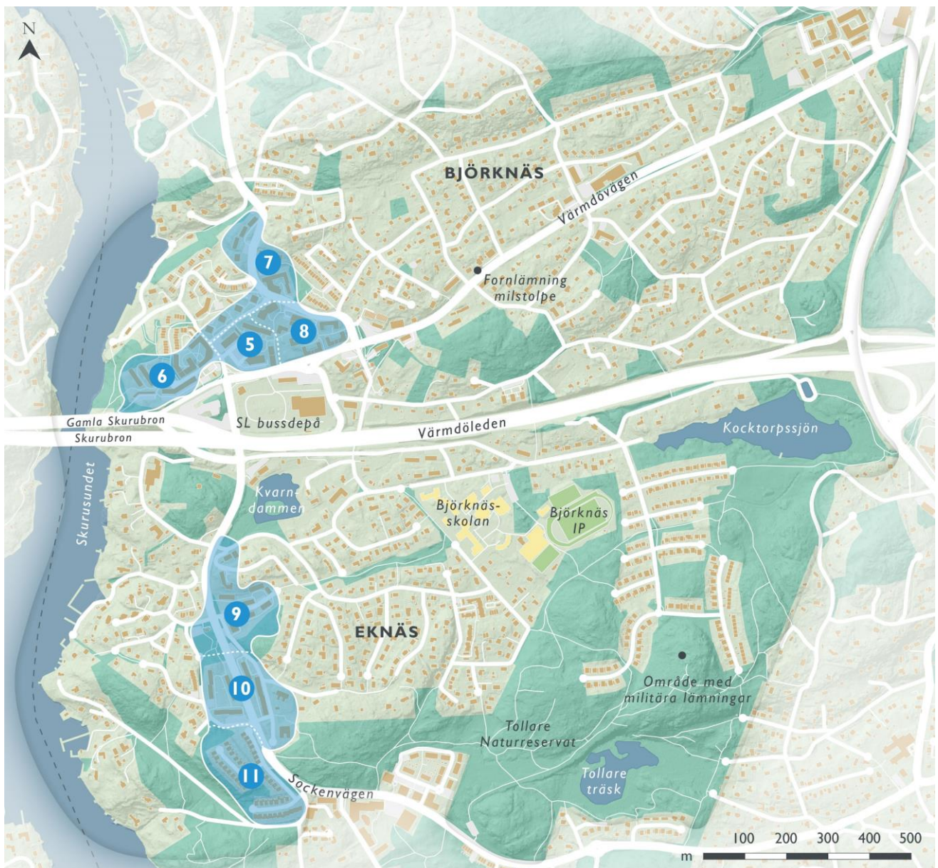
Figur 5. Centrumområdenas landskaps- och bebyggelsekaraktärer, delområde 5 - 11.

Nacka Seniorcenter Sofiero vid Talluddsvägen uppfördes som Boo kommuns ålderdomshem år 1955 och visar tidens höga sociala ambitioner. Bebyggelsen i två till tre våningar med gulputsade fasader och flera tidstypiska detaljer står kring en gemensam gård. I början av 1990-talet gjordes en i både utformning och volym fint anpassad tillbyggnad.