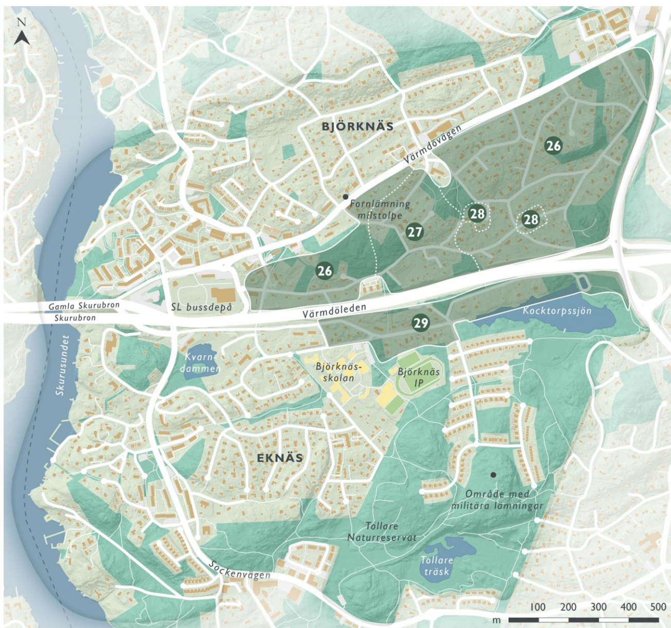
Figur 22. Landskaps- och bebyggelsekaraktärer i villabebyggelsen i Kocktorp, delområde 26 - 29.