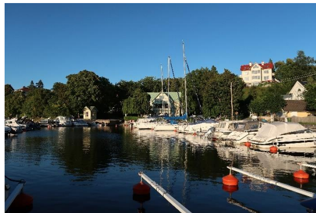
Figur 2. Skurusundet vid Eknäs.

Något längre bort från vattnet står flera mindre grupper av radhus och parhus främst från 1960-70-talen i det topografiskt varierade landskapet. Bebyggelsen förhåller sig väl till trädens naturliga höjdskala och har anpassats till de topografiska förutsättningarna. Majoriteten av husen är därför dolda från Skurusundet och gör inget intryck i siluetten. Utformningen varierar men de flesta har träfasader i gult, rött och vitt.