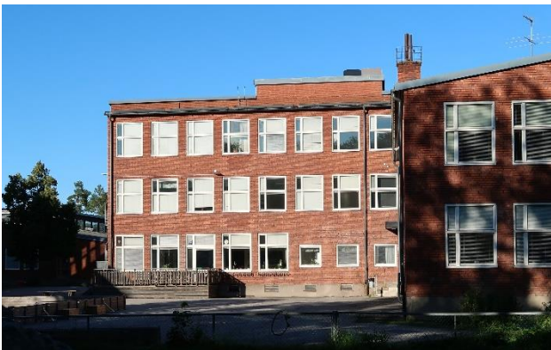
Figur 26. 1950-talets skolhusarkitektur vid Björknässkolan.

Öster om skolgården ligger Björknäs IP som invigdes 1967. Idrottsplatsen rymmer idag en idrottshall, fotbollsplan med friidrottsanläggning samt två isytor i isladan och istältet.