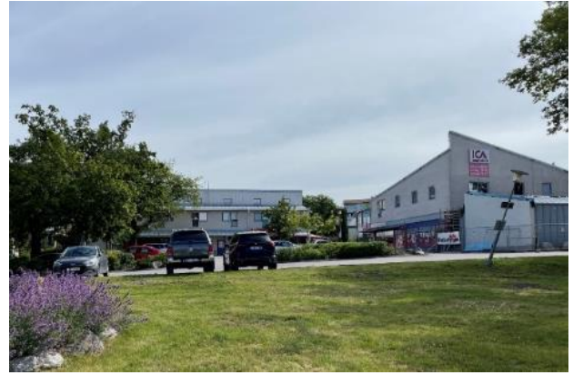
Figur 4. 1980-talets centrumbebyggelse i Björknäs centrum

Byggnaderna vänder sig inåt vilket skapar en intim platskänsla vid torget, samtidigt som orienteringen ger en baksideskänsla utåt mot Värmdövägen. Detta förstärks av det storskaliga vägrummet med parkeringsytor, SL:s bussdepå och Värmdöleden med sin påtagliga barriär mot Eknäs. Torget används idag främst som en parkeringsyta, men här finns insprängd naturlig vegetation. I väster, norr och öster ramas centrumområdet av områden med flerbostadshus och radhus. Gränsen mellan allmänna och privata platser är ofta otydlig och det kan vara svårt för fotgängare och cyklister att orientera sig i området. Det saknas även större gemensamma allmänna ytor som parker och allmänna lekplatser.