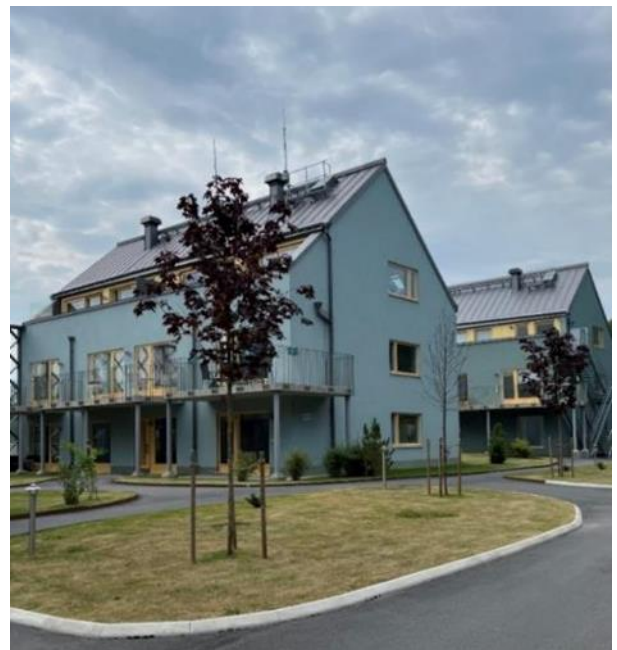
Figur 10. Flerbostadshus från 2020, Kocktorpsvägen.

Vid Kocktorpsvägen finns en mindre grupp med flerbostadshus som representerar den senaste utbyggnadsepoken i Björknäs. Husen som uppfördes 2019-2020 står på en höjd norr om Värmdöleden och utmärks genom sin placering på rad med de branta gavlarna vända mot vägen och av sina blågröna putsfasader och gula fönster. Mot motorvägen finns både bullerplank i vägslänten och höga bullerskärmar med spaljéliknande utseende mellan husen. Landskapet omkring husen är mycket ordnat med anlagda gräsmattor på platsen för en äldre villaträdgård.