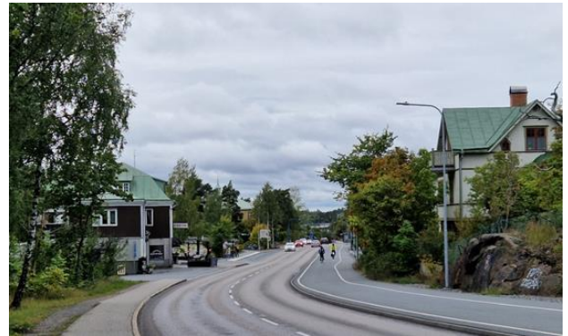
Figur 13. Vy över Värmdövägen västerut med Centralkonditoriet och Björknäskyrkan till vänster. En av områdets äldsta villor syns till höger i bilden.

med små servicebyggnader intill en kraftledningsgata och en infartsparkering.