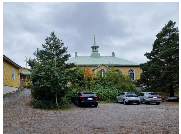
Figur 12. Björknäskyrkan.

Björknäskyrkan har trots förändringar bevarat sin ursprungliga karaktär och fungerar som ett landmärke på sin skogsklädda höjd. Byggnaden har även samhällshistoriska värden.