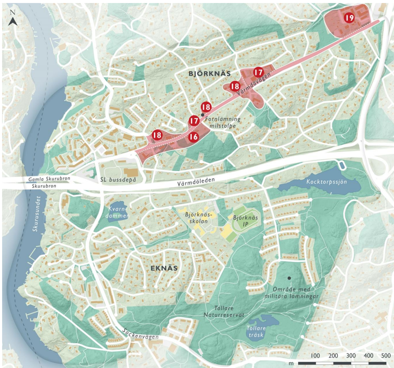
Figur 13. Landskaps- och bebyggelsekaraktärer vid Värmdövägen, delområde 16 - 19.

Längre österut vid Mercuriusvägen och intill 1950-talshusen vid Vintervägen finns ytterligare två flerbostadshus från 2010-talet som genom sina byggnadshöjder i upp till fyra våningar, i kombination med fasadutformningen och byggnadsdetaljerna, gör att byggnaderna skiljer sig markant från omgivningen och tar stor plats i landskapet.