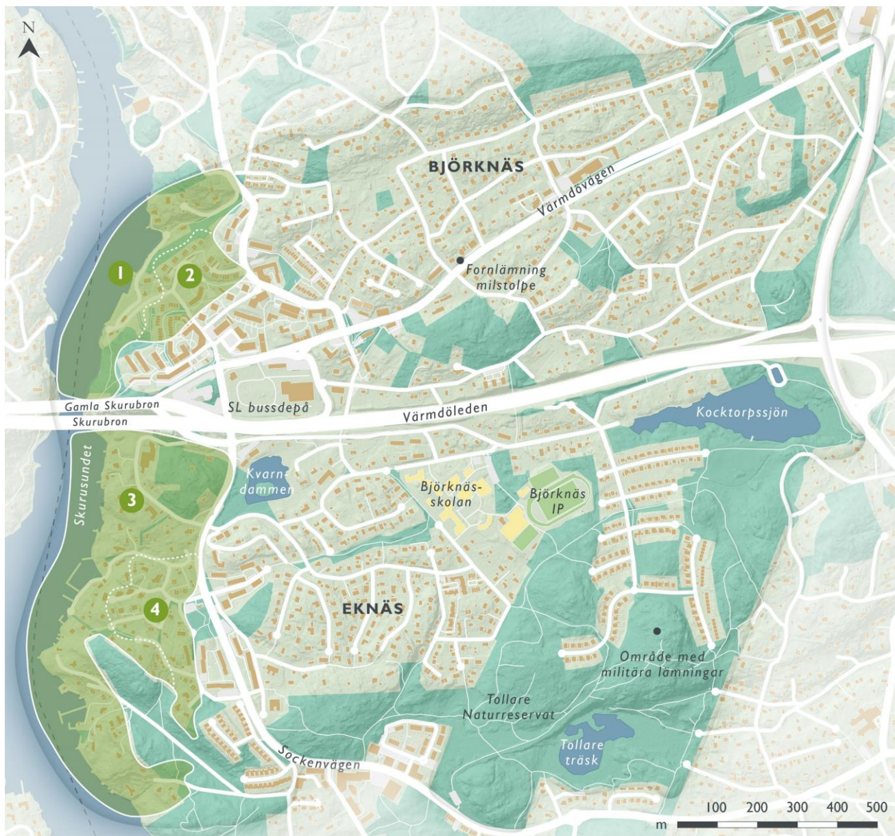
Figur 3. Kustlandskapets landskaps- och bebyggelsekaraktärer, delområde 1 - 4.