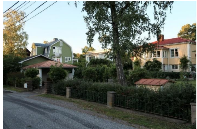
Figur 16. Äldre villabebyggelse vid Lövdalsvägen.

Längs Skogdalsvägen, Plantvägen och Lövdalsvägen ligger ett relativt flackt område som präglas av stora tomter med bevarade gamla träd och rik grönska.